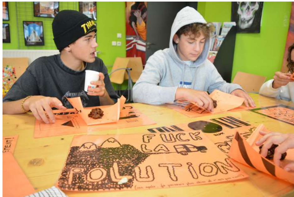
Ateliers avec le centre d'art des Capucins d'Embrun Avec les 3èmes C du collège des écrins Atelier affiches à la photocopieuse et grand repas Réalisation de sets de table et de cornets à friandises avec les messages des élèves