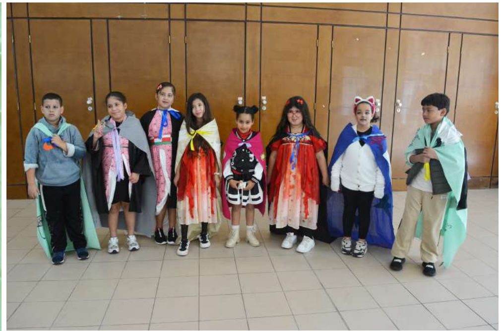
Rouvrir le monde - Centre social La Provence à Aix-en-Provence Atelier couture Confection de capes avec les enfants de 6 à 10 ans