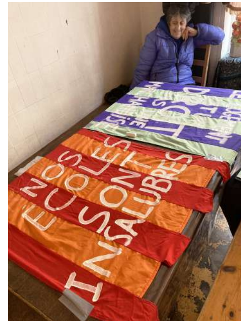
Ateliers création de drapeaux avec les habitants du quartier de le Belle de mai Cantine du midi - en partenariat avec la Réserve des Arts et le Café causé Les habitants ont peint leurs revendications