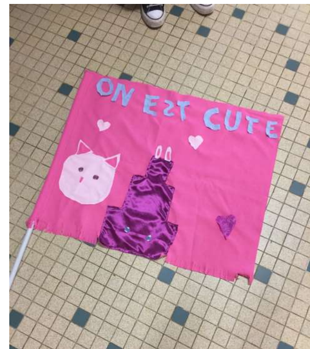
Rouvrir le monde - Centre social La Provence à Aix-en-Provence Atelier couture Confection de drapeaux avec les slogans et revendications des enfants