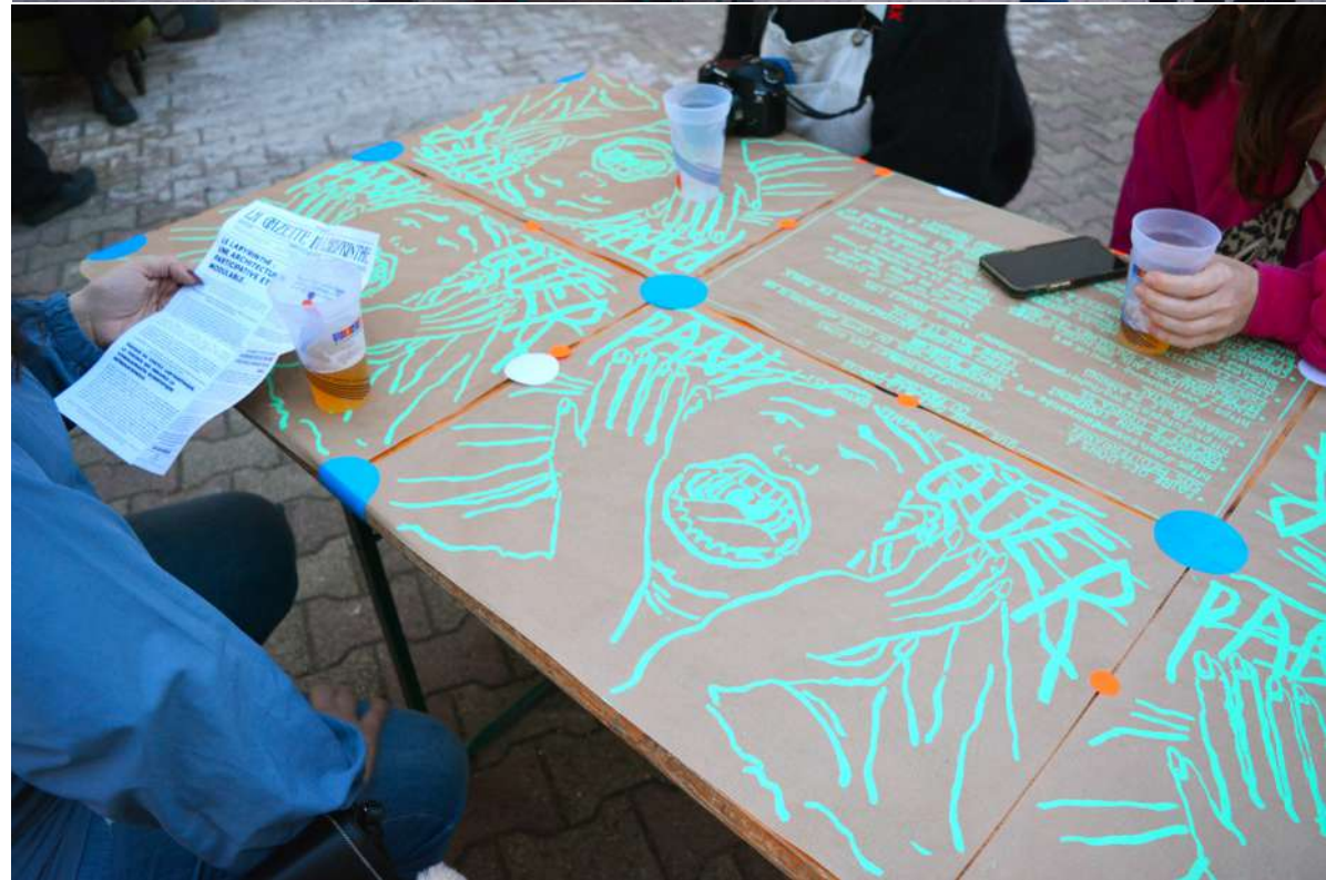
Scénographie de repas pour la sortie de résidence - Réserve des arts Sets de table / affiches contre la montée du fachisme sérigraphie sur papier kraft récupéré à la Réserve des arts