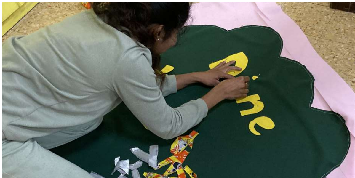
Ateliers couture de drapeaux Au centre social Bausseque, dans le panier à marseille 4 samedis après-midi les mamans et leurs enfants se sont retrouvés pour coudre leurs messages