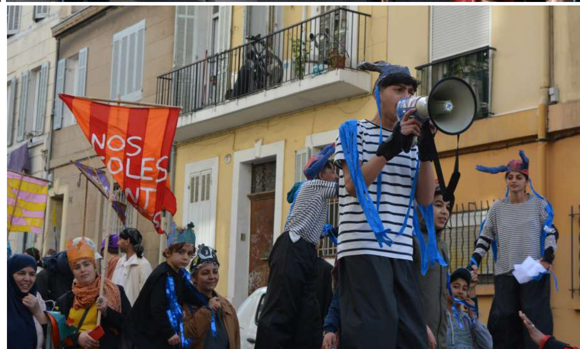
Carnaval du quartier de le Belle de mai organisé par le Café causé Les habitants défilent avec les banderoles qu'ils ont peint