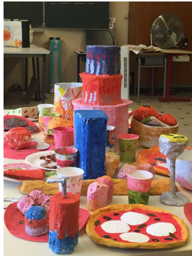
Rouvrir le monde - Centre social La Provence à Aix-en-Provence Confection d'un banquet gargantuesque en papier mâché