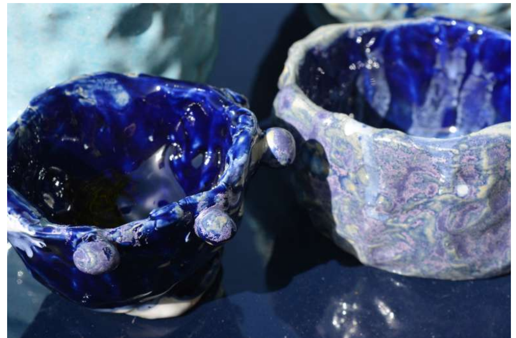
Rouvrir le monde - Centre social Beausseque à Marseille Atelier céramique avec les mamans et les enfants Réalisation de vaisselle en vue d'un banquet