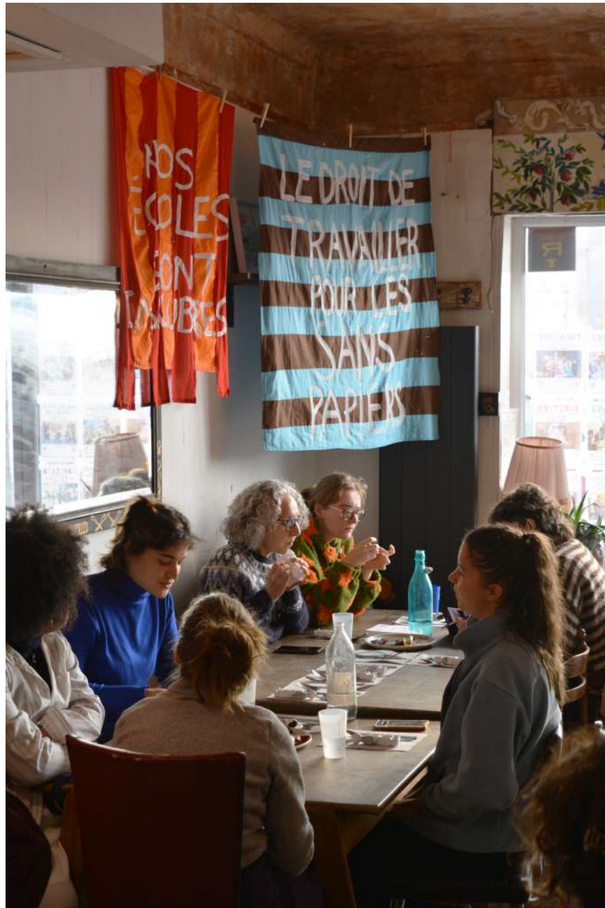
Repas de soutien à la Palestine organisé à la Cantine du midi en partenariat avec la Réserve - Le menu était de Malo Barette Nous avons partagé un repas à prix libre pour reversé à la SAWT Palestine Confection de couverts à cette occasion et utilisation des assiettes de lutte en céramique