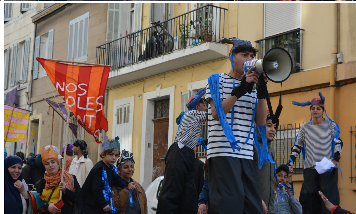
Carnaval du quartier de le Belle de mai organisé par le Café causé Les habitants défilent avec les banderoles qu'ils ont peint