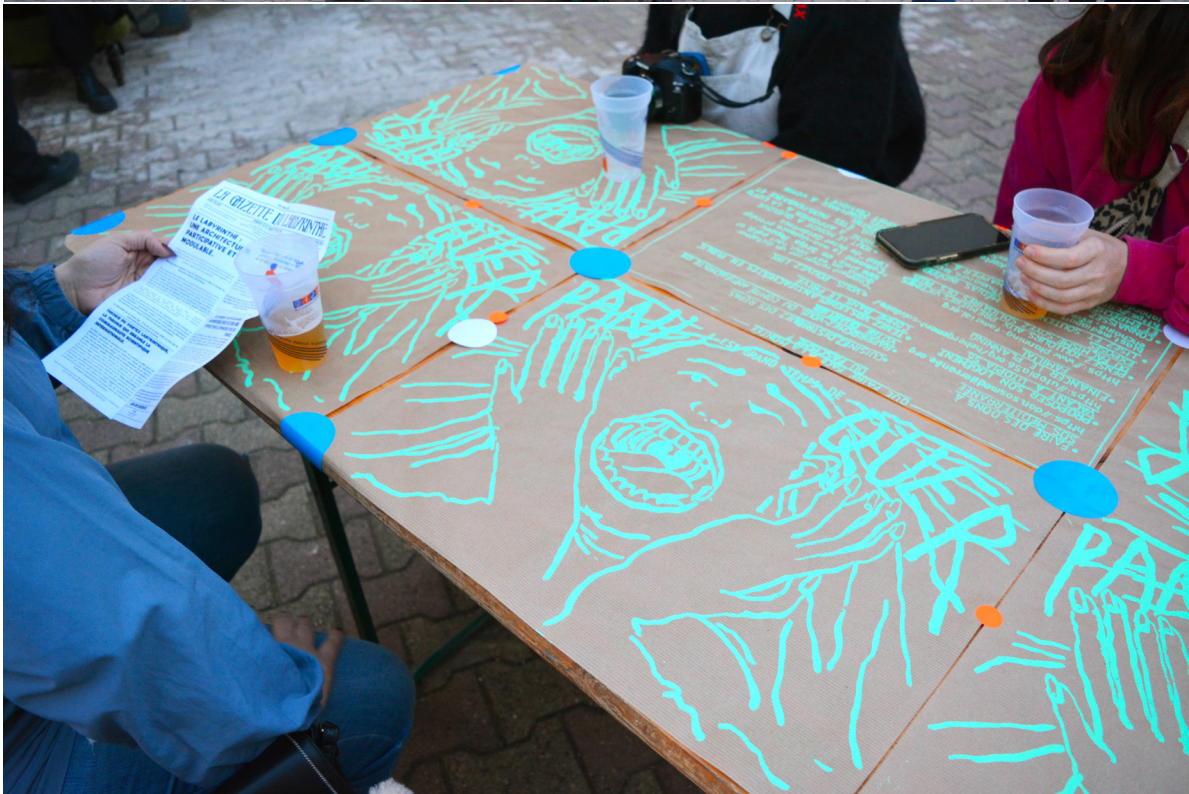
Scénographie de repas pour la sortie de résidence - Réserve des arts Sets de table / affiches contre la montée du fachisme sérigraphie sur papier kraft récupéré à la Réserve des arts