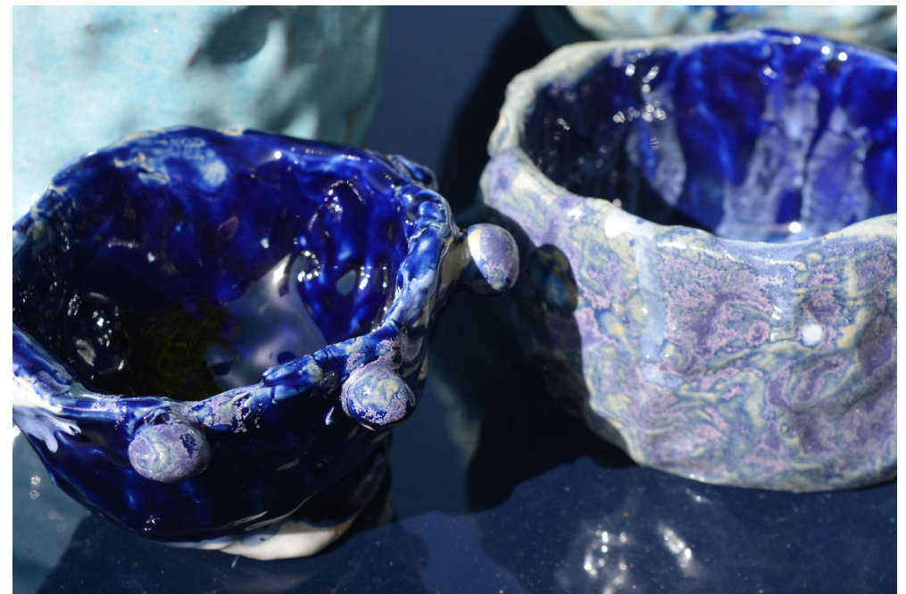
Rouvrir le monde - Centre social Beausseque à Marseille Atelier céramique avec les mamans et les enfants Réalisation de vaisselle en vue d'un banquet