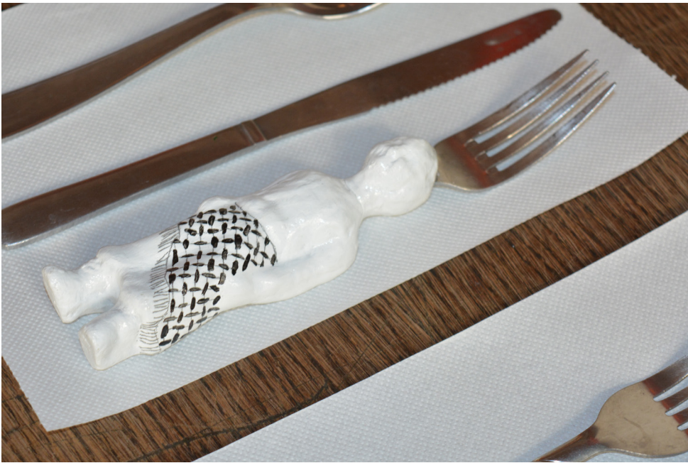
Repas de soutien à la Palestine organisé à la Cantine du midi en partenariat avec la Réserve - Le menu était de Malo Barette Nous avons partagé un repas à prix libre pour reversé à la SAWT Palestine Confection de couverts à cette occasion et utilisation des assiettes de lutte en céramique