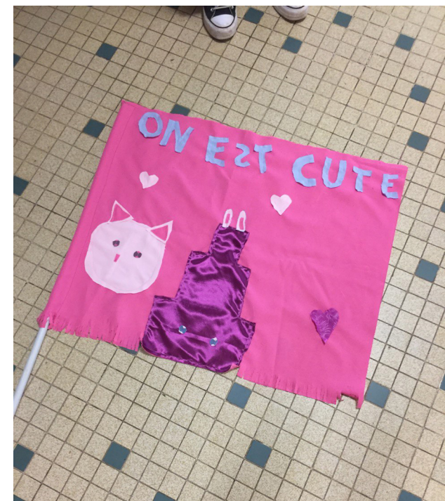
Rouvrir le monde - Centre social La Provence à Aix-en-Provence Atelier couture Confection de drapeaux avec les slogans et revendications des enfants