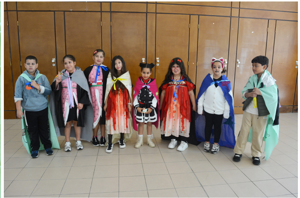
Rouvrir le monde - Centre social La Provence à Aix-en-Provence Atelier couture Confection de capes avec les enfants de 6 à 10 ans