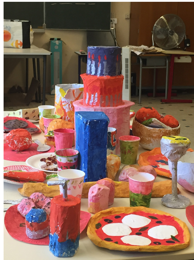
Rouvrir le monde - Centre social La Provence à Aix-en-Provence Confection d'un banquet gargantuesque en papier mâché