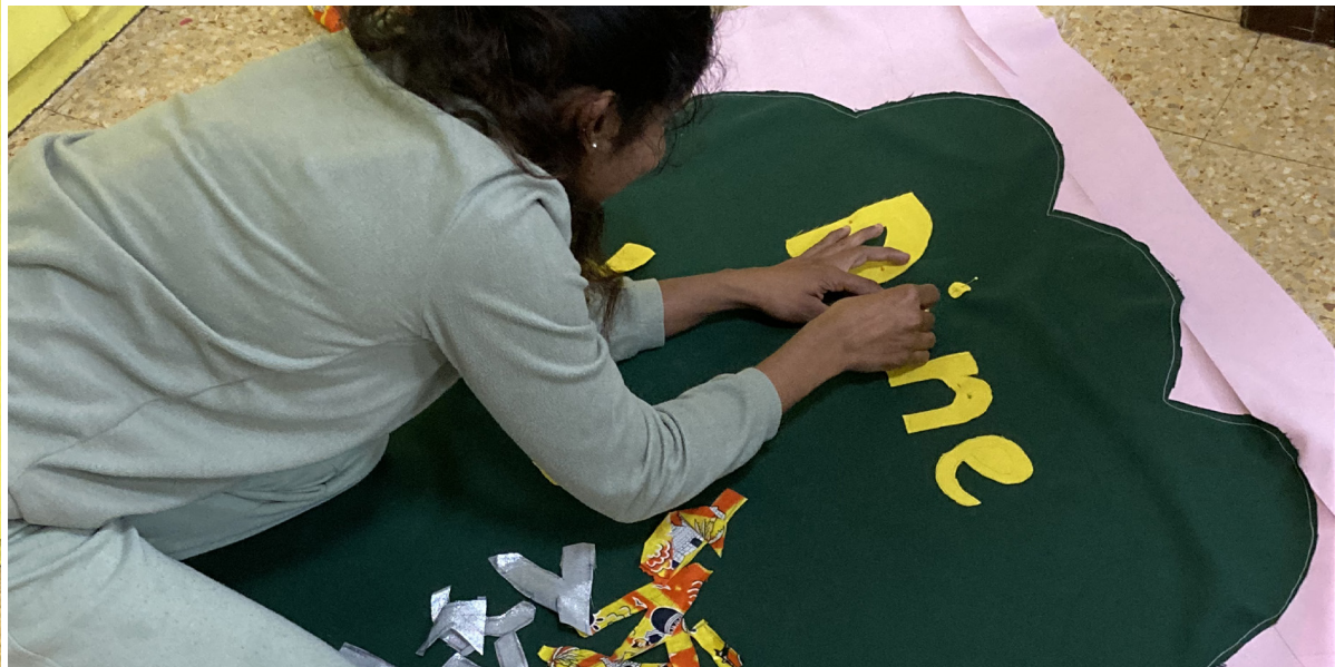
Ateliers couture de drapeaux Au centre social Baussenque, dans le panier à marseille 4 samedis après-midi les mamans et leurs enfants se sont retrouvés pour coudre leurs messages