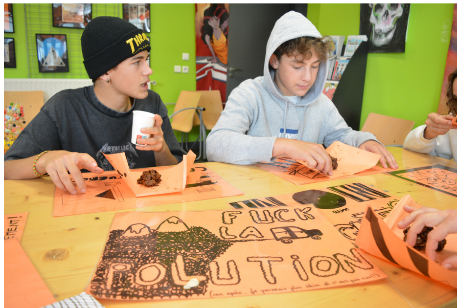
Ateliers avec le centre d'art des Capucins d'Embrun Avec les 3èmes C du collège des écrins Atelier affiches à la photocopieuse et grand repas Réalisation de sets de table et de cornets à friandises avec les messages des élèves