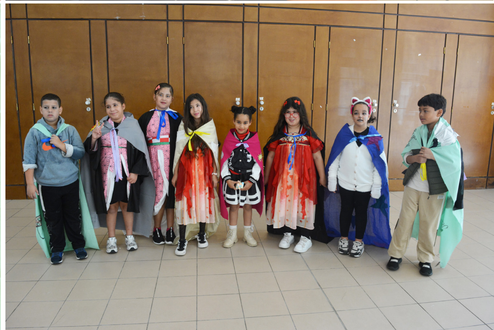
Rouvrir le monde - Centre social La Provence à Aix-en-Provence Atelier couture Confection de capes avec les enfants de 6 à 10 ans