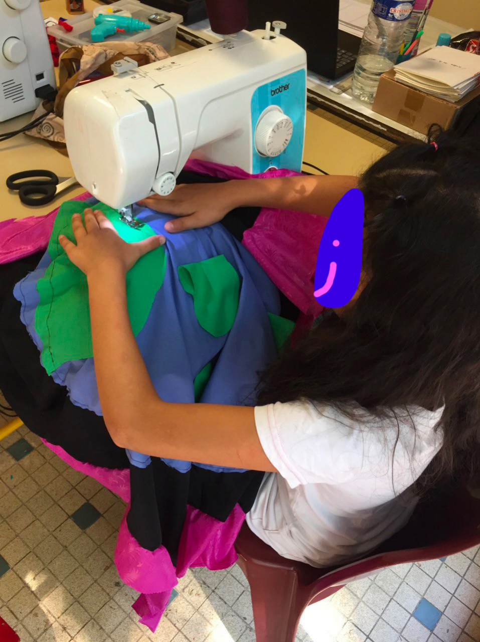
Rouvrir le monde - Centre social La Provence à Aix-en-Provence Atelier couture Confection de drapeaux avec les slogans et revendications des enfants